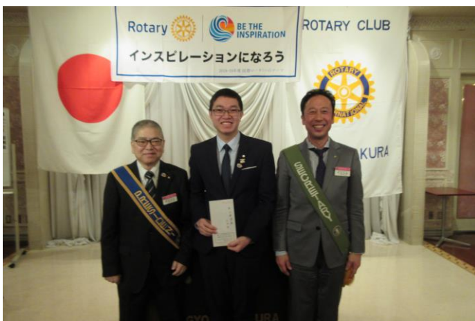
チャンマンタン君