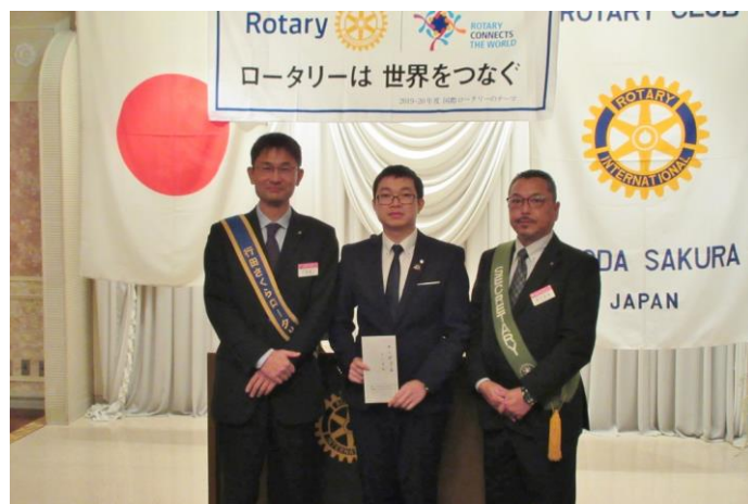
チャンマンタン 君