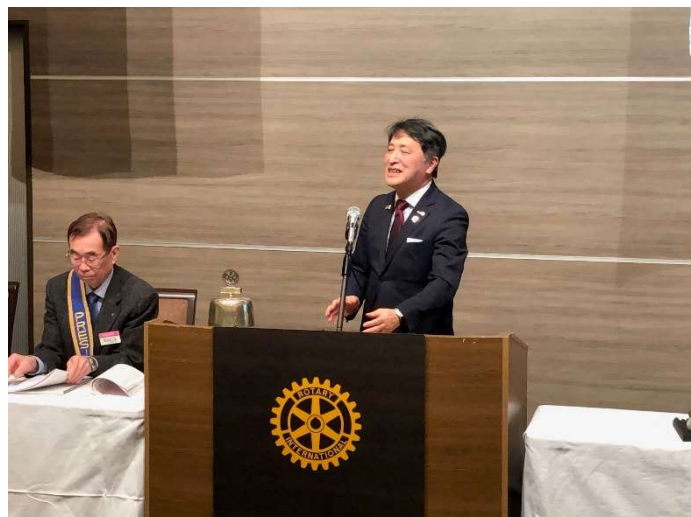
五十幡和彦ガバナーエレクト